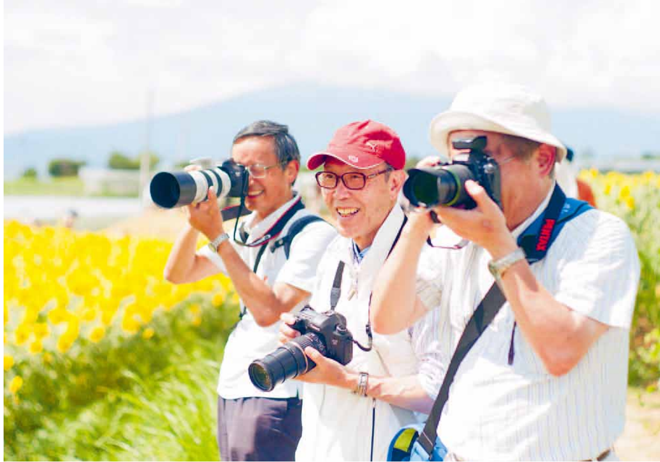
満開のひまわり畑での写真撮影専門の旅の様子