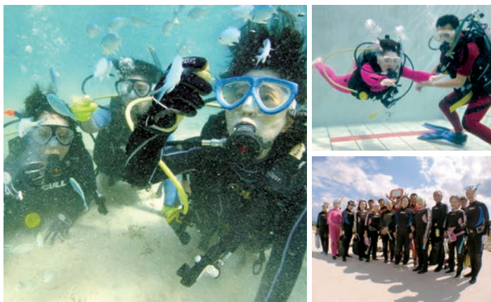
左/全3回の講座で学び、憧れの宮古島でダイビング 右上/プール講座では講師陣が丁寧にサポートします 右/宮古島の海を前に笑顔いっぱいの皆様