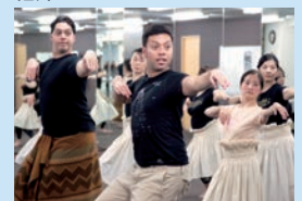
フラダンスでよい汗をかこう!